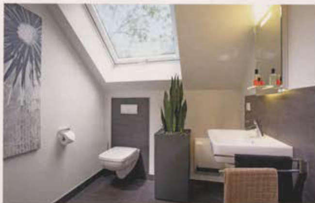
Neben dem komfortablen, 13,5 m 2 großen Bad im Elternschlaftrakt gibt es im Obergeschoss ein zusätzliches Dusch-WC für die Kinder.