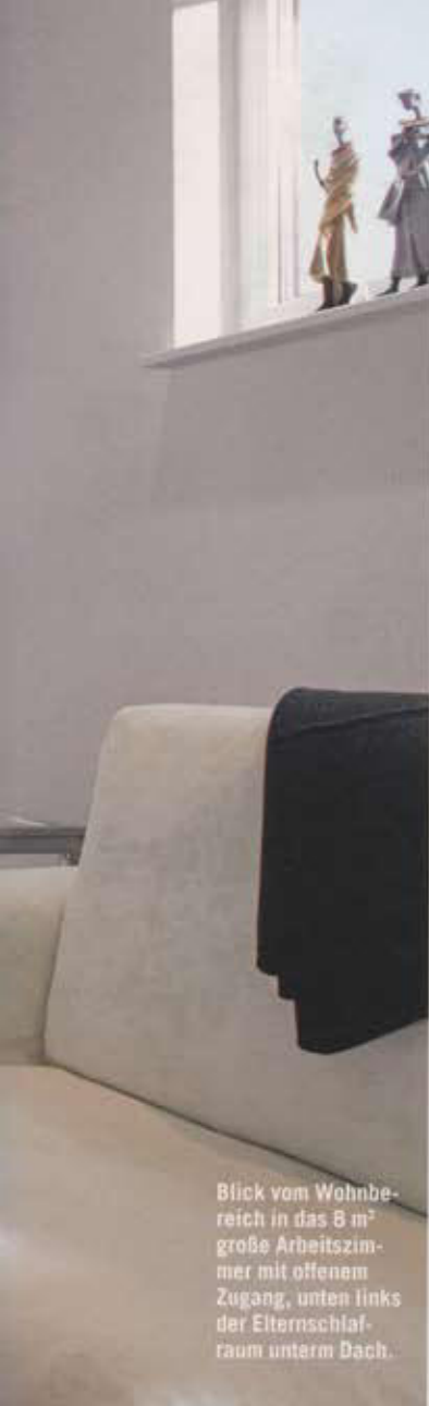
Blick vom Wohnbereich in das 8 m 2 große Arbeitszimmer mit offenem Zugang, unten links der Elternschlafraum unterm Dach.