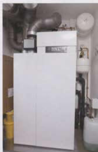
Erdwärmepumpe und Lüftungsanlage mit Wärmerückgewinnung sorgen für sparsamen Energieverbrauch.

schend viel Platz für die Kinder und die Eltern nicht nur in den Schlafräumen, sondern auch in dem hellen Bad. Der Zugang zum großen Balkon ist sowohl vom Elternschlaf- als auch von einem Kinderzimmer aus mög-