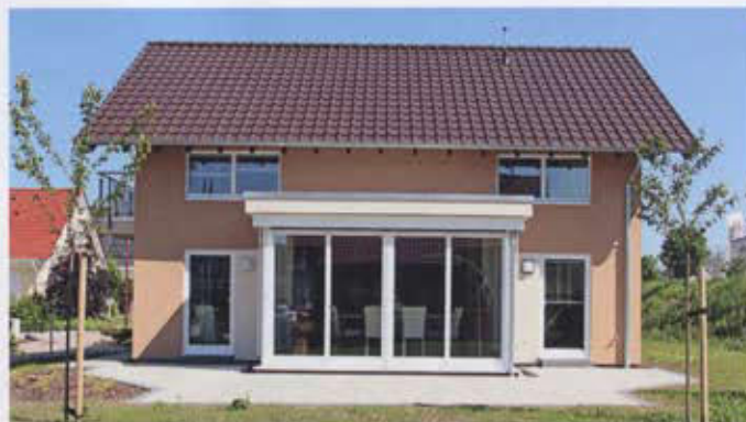
Der Wintergarten mit Flachdach erweitert den Wohnraum und bringt viel Tageslicht.