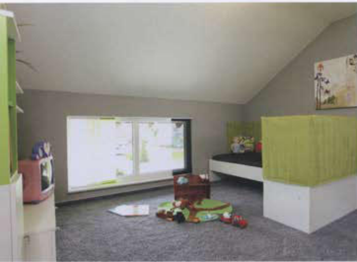
Das Dachgeschoss wird über eine breite gewendelte Holztreppe erreicht und bietet viel Platz für Eltern und Kinder...