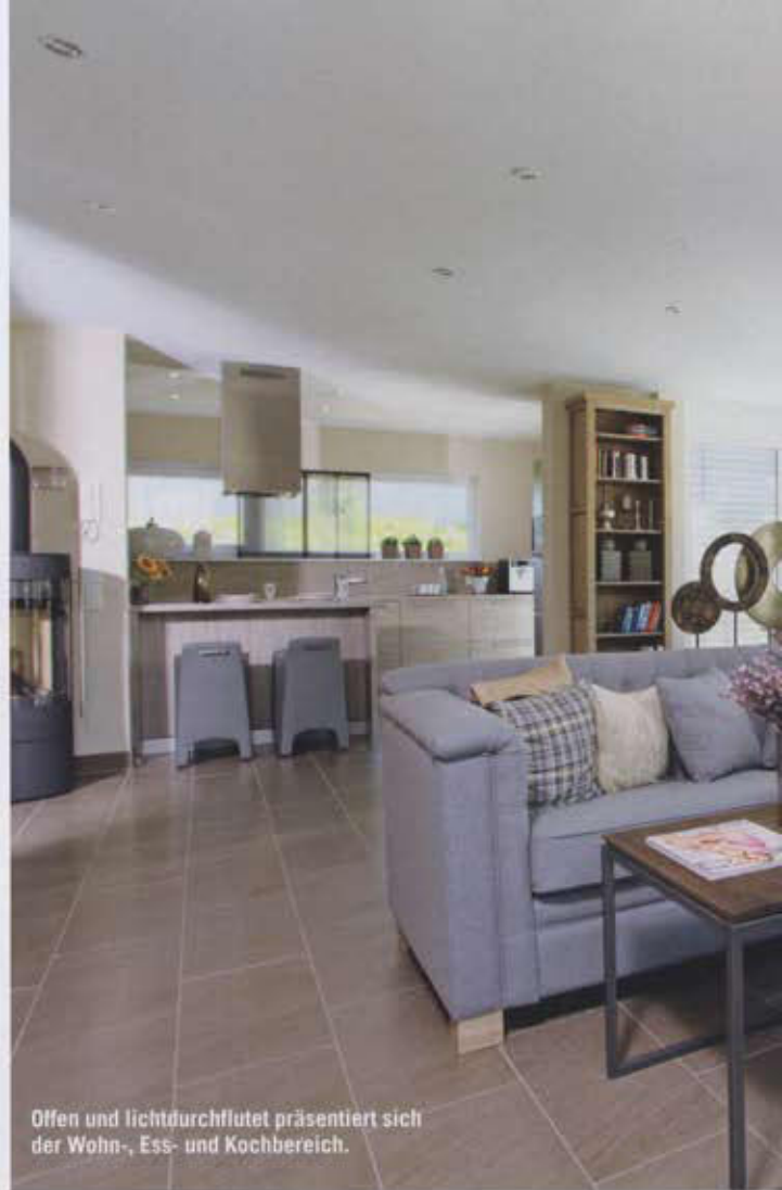
Offen und lichtdurchflutet präsentiert sich der Wohn-, Ess- und Kochbereich.

geplant werden, oder sogar als drittes Kinderzimmer. Der Kaminofen am Übergang vom Koch- zum Ess-/Wohnbereich dient nicht nur zur Heizungsunterstützung, sondern sorgt darüber hinaus für eine ge-