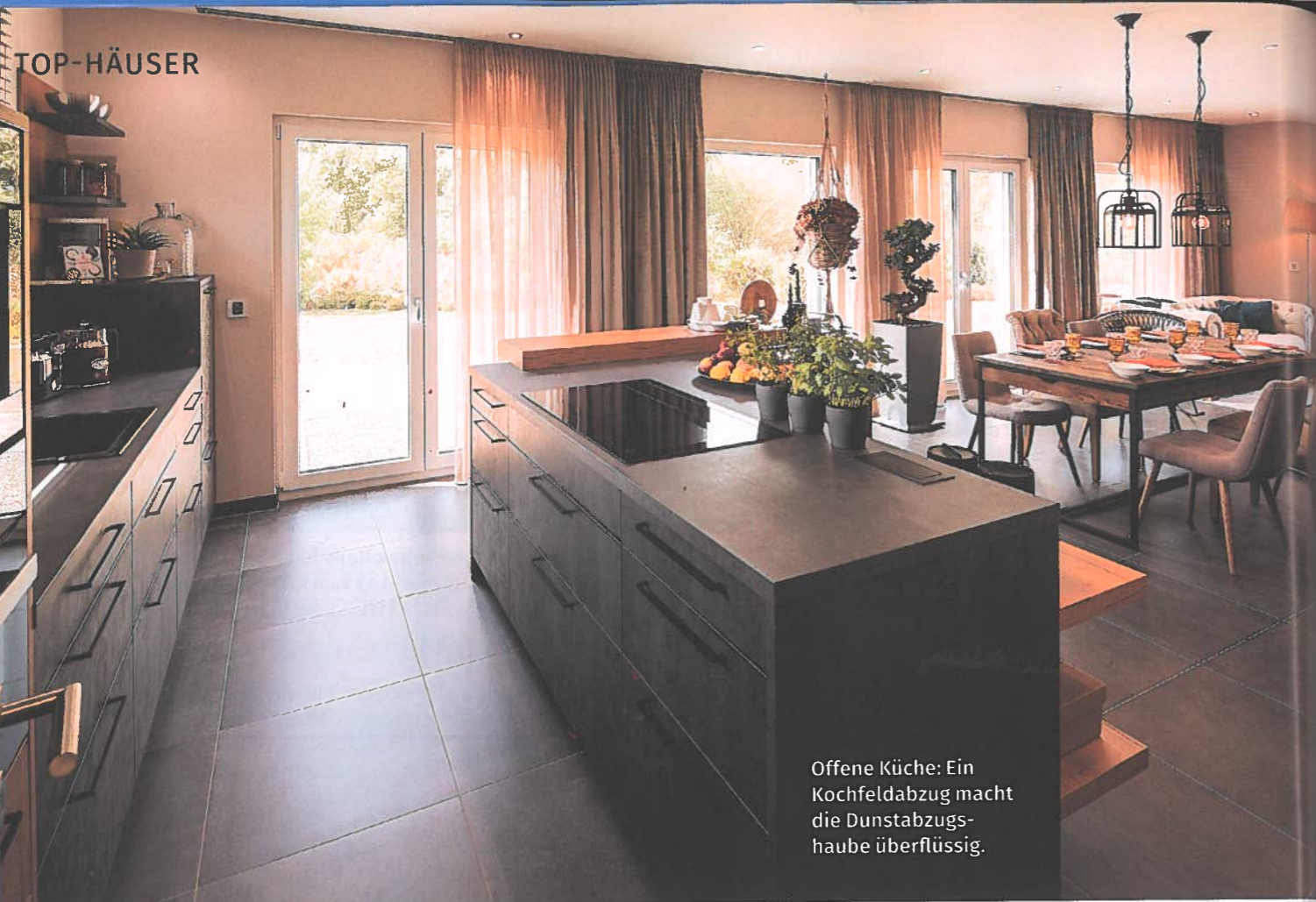
Offene Küche: Ein Kochfeldabzug macht die Dunstabzugshaube überflüssig.

Auf rund 180 Quadratmetern bietet das neue Musterhaus viel Komfort und sogar Raum für Extrawünsche