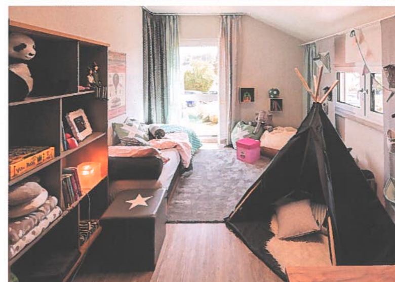
Gerecht: Die beiden Kinderzimmer sind gleich groß und haben jeweils Fenster nach zwei Seiten. Das sorgt für eine friedliche Atmosphäre.