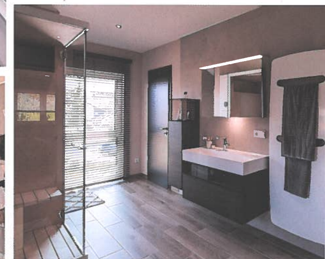
Sauber: Hochwertige Bad-Einrichtung mit Dusche, Wanne, Saunakabine und edlen Möbeln.

Mehr Häuser des Anbieters zuhause3.de/fingerhaus