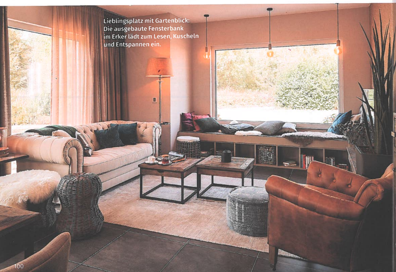
Lieblingsplatz mit Gartenblick: Die ausgebaute Fensterbank im Erker lädt zum Lesen, Kuscheln und Entspannen ein.

Auf rund 180 Quadratmetern bietet das neue Musterhaus viel Komfort und sogar Raum für Extrawünsche