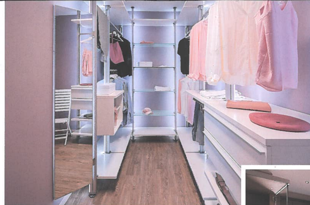
Elegant: Der separate Ankleideraum erspart große Schränke im Schlafzimmer.

Mehr Häuser des Anbieters zuhause3.de/fingerhaus