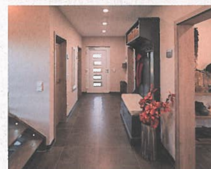
Von der großzügigen Diele gehen Küche, Wohn-Esszimmer, Technikraum, Duschbad und der Abstellraum ab.