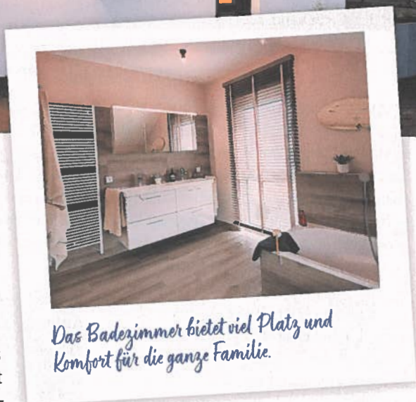
Das Badezimmer bietet viel Platz und Komfort für die ganze Familie.

Nähert man sich diesem Musterhaus von der Eingangsseite, fallen die farbigen Putzstreifen der ansonsten hellen Fassade auf. Sie verbinden die Fenster traufseitig im Dachgeschoss und laufen im Erdgeschoss übereck. Während das Haus auf der Straßenseite die Privatsphäre seiner Bewohner schützt, lässt es an den gartenseitigen Trauf- und Giebelseiten viel Licht ins Haus.