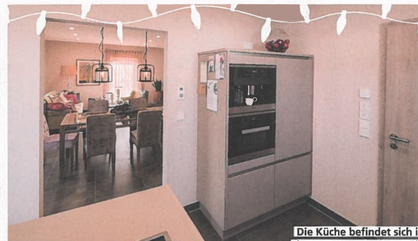
Die Küche befindet sich in einem separaten Raum. Ein Durchgang ermöglicht jedoch den schnellen Wechsel in das Wohn-Esszimmer.

platzierte, innen gekachelte Duschnische mit Regendusche. Die Wandumfassung der Dusche dient gleichzeitig der dezenten Abschirmung des dahinterliegenden WCs. Badewanne, Doppelwaschtisch und Handtuchrockner komplettieren das Badezimmer im Dachgeschoss.