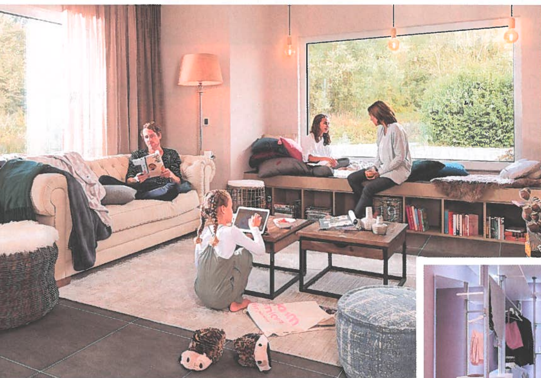
Lieblingsplatz mit Gartenblick: Die ausgebaute Fensterbank im Erker lädt zum Lesen, Kuscheln und Entspannen ein.