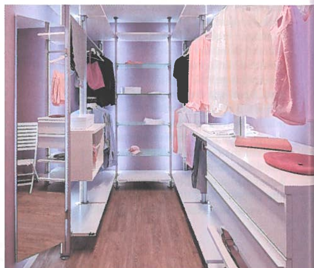
Elegant: Der separate Ankleideraum erspart große Schränke im Schlafzimmer.

Auf rund 180 Quadratmetern bietet das neue Musterhaus viel Komfort und reichlich Raum für Extrawünsche