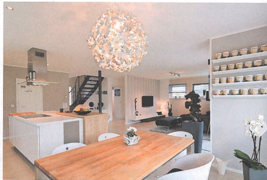
Das Erdgeschoss ist ein einziger riesiger Raum, in dem Kochen, Essen und Wohnen fließend ineinander übergehen.

und Kochen fließend ineinander übergehen. Nur das kompakte Arbeitszimmer, der Hauswirtschaftsraum und das Gäste-WC bilden zusätzliche Einheiten.