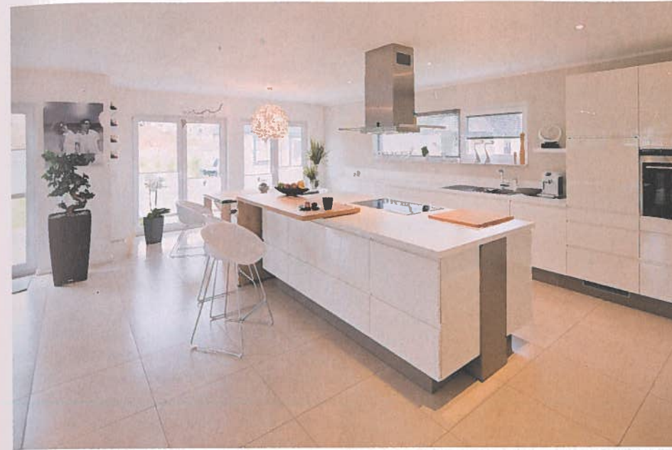
Direkt neben der Küche schließt sich der Essplatz an. Aber auch ein Platz an der Bar bietet die Möglichkeit für den schnellen Snack zwischendurch. Dies fördert außerdem die Kommunikation in der Küche.