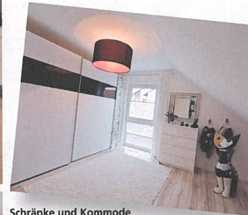
Schränke und Kommode sind im separaten Ankleideraum untergebracht. Das schafft mehr Raum im Schlafzimmer.