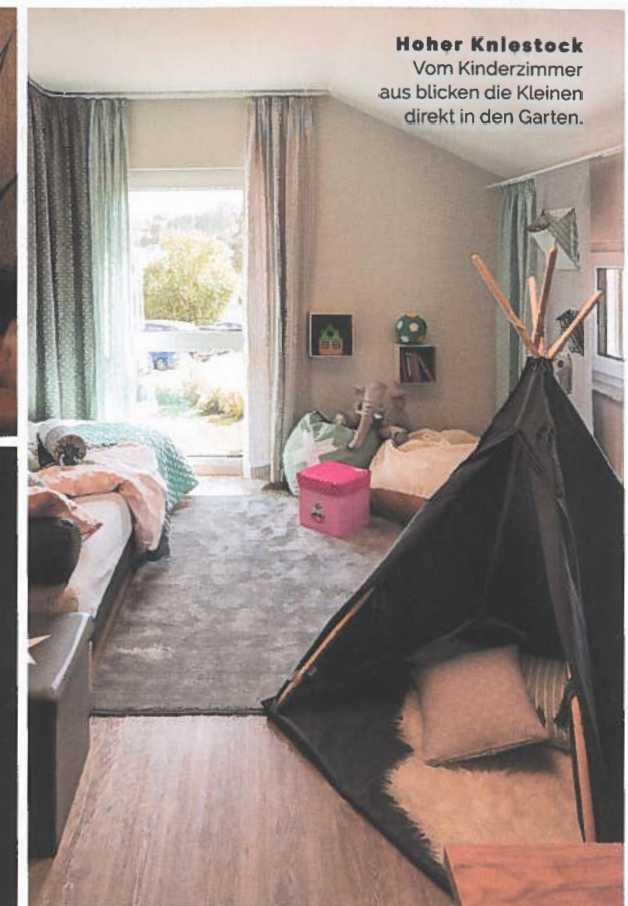
Hoher Kniestock Vom Kinderzimmer aus blicken die Kleinen direkt in den Garten.