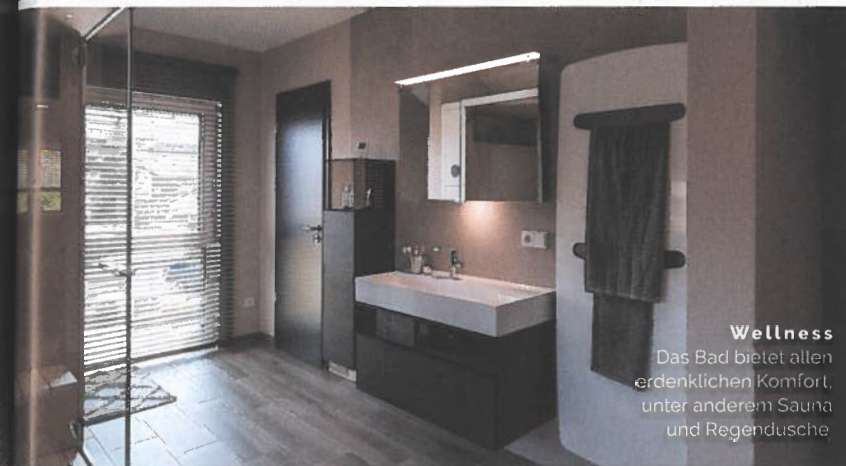
Wellness Das Bad bietet allen erdenklichen Komfort, unter anderem Sauna und Regendusche.