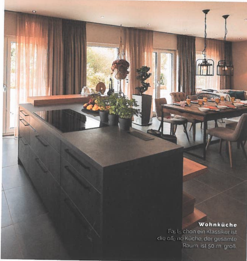
Wohnküche Fürs schon ein Klassiker ist die offene Küche, der gesamte Raum ist 50 m 2 groß.

D irekt am Firmenstandort hat FingerHaus sein neues Musterhaus eröffnet. Das „SENTO 500 B“ bietet jede Menge Komfort: eine Sauna, eine Ankleide und ein zusätzliches Zimmer im Erdgeschoss. Zudem besitzt es eine umfassende Smart-Home-Ausstattung, die erste des Herstellers auf KNX-Basis. Der Eingangsbereich wirkt äußerst repräsentativ. Die Eingangsüberdachung erstreckt sich fast über die gesamte Traufseite. Dunkles Dach, weiße Putzfassade, farbige Fensterrahmen und der warme Ton der Holzverschalungen lassen das Haus einladend aussehen. Das Satteldach mit seiner flachen Dachneigung von nur 25 Grad erlaubt einen Kniestock von 2,15 Metern im Dachgeschoss und schafft so das Raumgefühl wie bei einem zweiten Vollgeschoss. Auf nahezu 180 Quadratmetern sind auf Wunsch viele Sonderwünsche umsetzbar. Auffällig im Erdgeschoss ist das Arbeitszimmer gleich rechts von der Diele. Großzügig präsentiert sich das Wohn-Esszimmer mit offener Küche auf fast 50 Quadratmetern. Praktisch