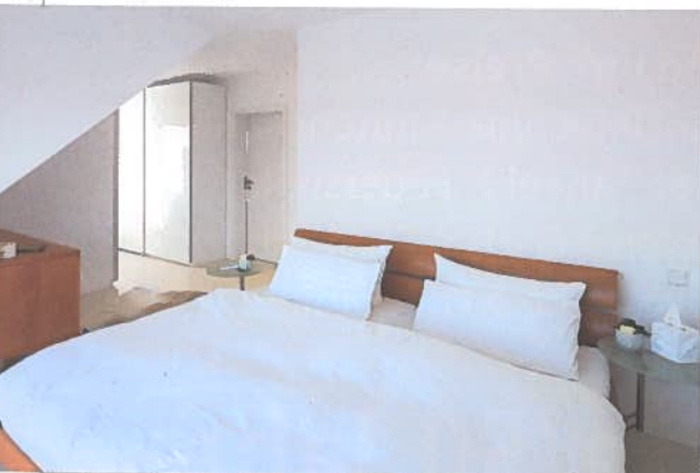
Das helle Elternschlafzimmer ist unterteilt in Schlafbereich mit Bett unter der Dachgaube und Ankleide mit großen Einbau-Kleiderschränken.