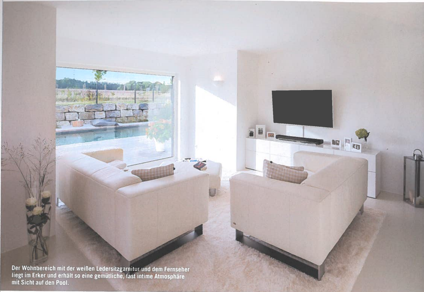
Der Wohnbereich mit der weißen Ledersitzgarnitur und dem Fernseher liegt im Erker und erhält so eine gemütliche, fast intime Atmosphäre mit Sicht auf den Pool.

Die bewusst üppig bemessene Diele bildet den Auftakt zum großzügigen Erdgeschoss und führt über die schöne Treppe nach oben zu den Privaträumen.