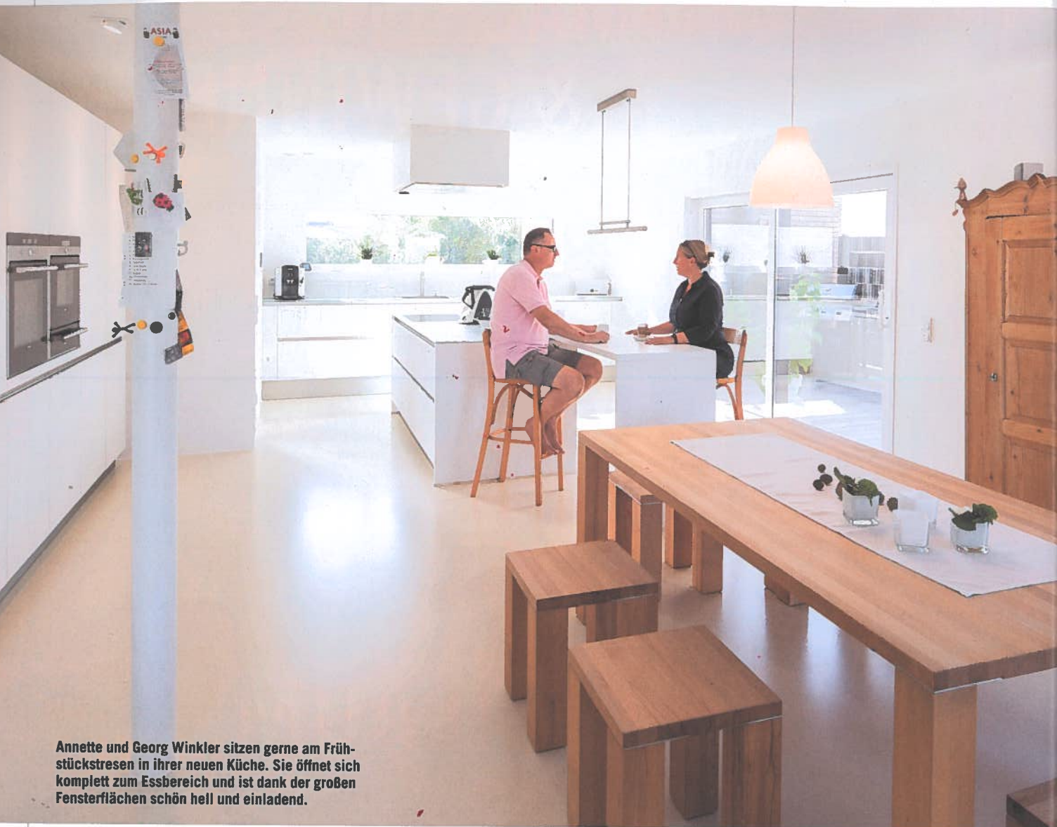
Annette und Georg Winkler sitzen gerne am Frühstückstresen in ihrer neuen Küche. Sie öffnet sich komplett zum Essbereich und ist dank der großen Fensterflächen schön hell und einladend.