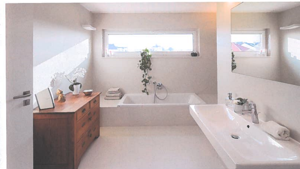
Im Obergeschoss gibt es zwei Bäder. Dieses ist das geräumige Elternbad mit Badewanne und Dusche hinter der Waschtischwand. Direkt nebenan ein Raum mit Waschmaschine und Trockner.

fas liegt im Erker und bietet den besten Blick auf den Pool. „Wir wollten eigentlich nur einen Garten ohne Pflegeaufwand“, sagt Annette Winkler lachend.