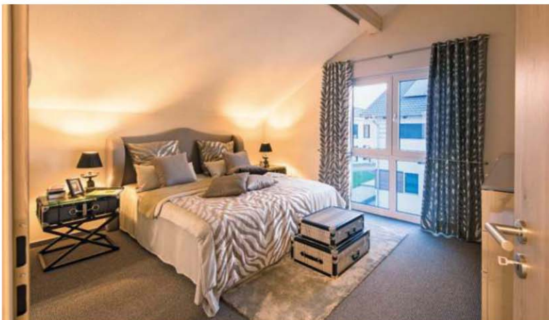
Die Eltern verfügen hier über einen ganz eigenen Bereich aus Schlafen, Ankleide und Wellnessbad.

erzeugt es dank hochgedämmter THERMO+ Gebäudehülle und effizienter Haustechnik mehr Energie als es selbst zum Betrieb benötigt. Zum Energiekonzept gehören eine Luft/Wasser-Wärmepumpe mit Fußbodenheizung, eine Photovoltaikanlage und eine Lüftungsanlage mit Wärmerückgewinnung. Der Komfort kommt ebenfalls nicht zu kurz: Elektrische Raffstores, Wind- und Sonnensensoren sowie Zeitschaltuhren sorgen für die Beschattung im richtigen Augenblick. Die Dachfenster lassen sich dank elektrochromer Verglasung in vier Stufen abdunkeln, was an sonnigen Tagen eine Aufheizung des Dachgeschosses verhindert.