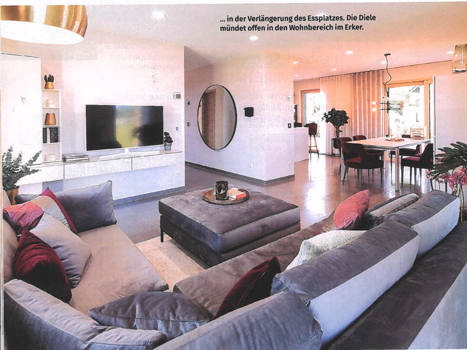
... in der Verlängerung des Essplatzes. Die Diele mündet offen in den Wohnbereich im Erker.