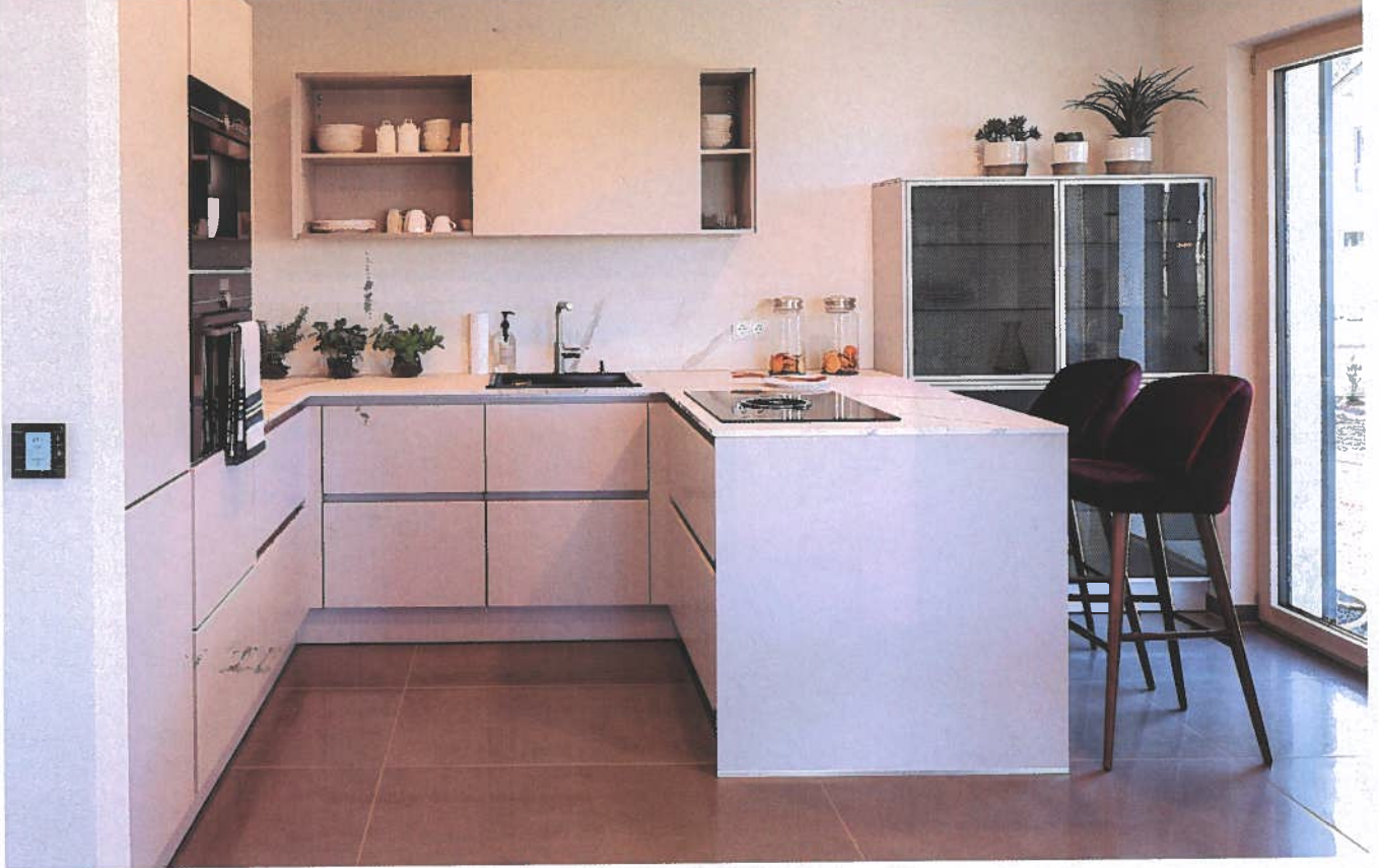
Die praktische Küche mit Frühstückstresen verbirgt sich ...