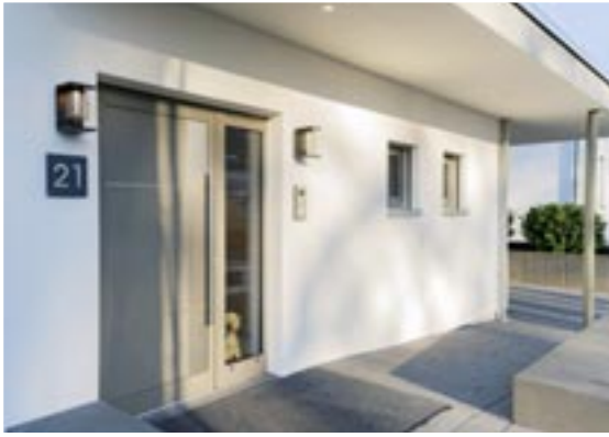
Einfach clever: Das schützende Vordach über dem Hauseingang geht nahtlos in den Carport über.

Über die geradläufige, schlicht-schöne Holzterrasse mit Brüstungswand gehen wir nun hinauf in die obere Etage. Gleich die erste Tür führt ins 11 Quadratmeter große Familienbad. An der Wand zur Wellness-Dusche im XL-Format ist platzsparend der Waschtisch montiert. Außer der Dusche gibt es eine nostalgisch anmutende, freistehende Badewanne mit Standardarmatur. Ein halbhoher Fliesenspiegel schützt die Wand dahinter vor den Folgen ausgelassener Planschvergnügen. Gleich neben dem Bad ist der bereits erwähnte Hauswirtschaftsraum platziert.