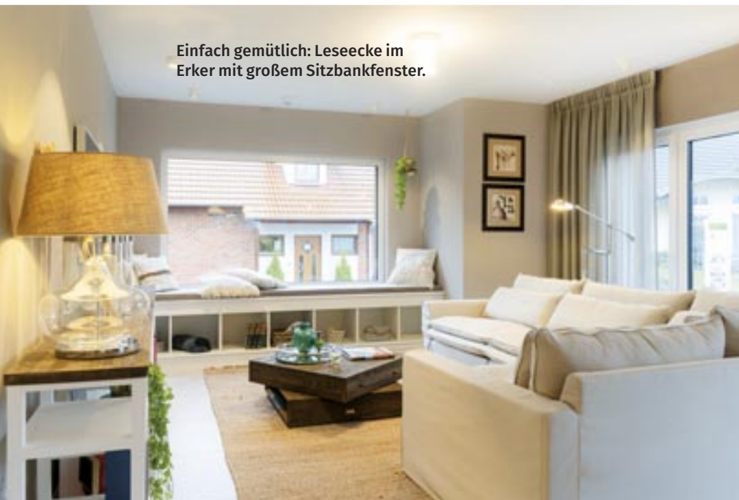
Einfach gemütlich: Leseecke im Erker mit großem Sitzbankfenster.