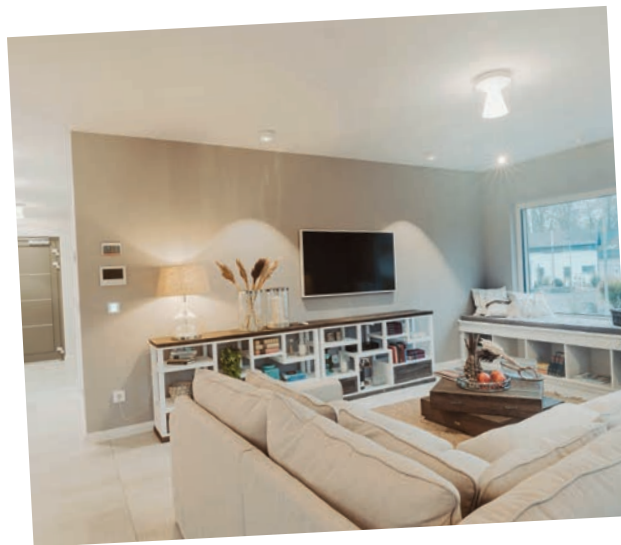
Im Wohnbereich lädt neben dem gemütlichen Ecksofa das Sitzfenster zum Relaxen ein.

Küche, Ess- und Wohnbereich gehen offen ineinander über. Der Erkerbereich des Quergiebels bietet den perfekten Platz für den Esstisch.